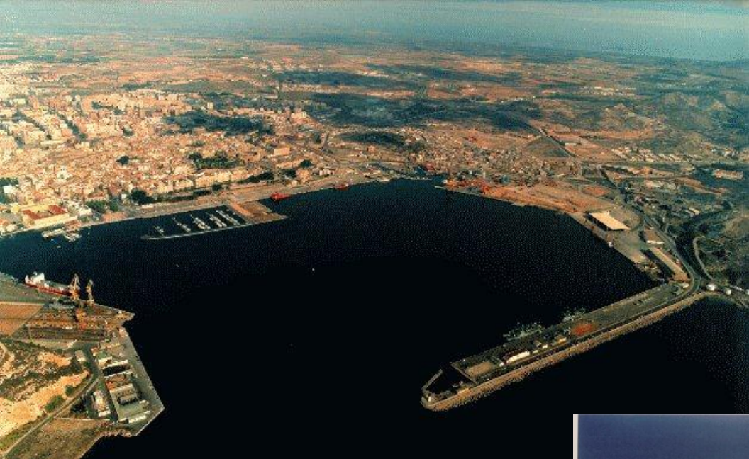
PUERTOS DE CARTAGENA (arriba) Y ALGECIRAS