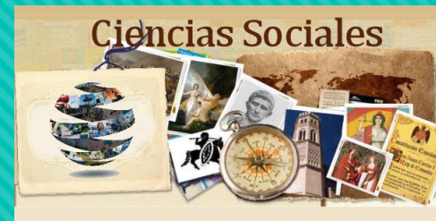
Imagen de Autor desconocido se concede bajo licencia de CC BY-SA